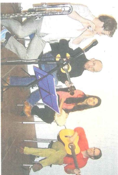
Le quatuor Nota de Choro a interprété des airs populaires brésiliens.